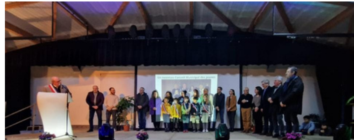
Le Maire a présenté l'ensemble des conseillers municipaux présents, ainsi que les 6 élus du Conseil Municipal des Jeunes

Il est revenu sur le dynamisme du monde associatif Bessinois, et a également remercié l'ensemble des forces vives de la commune : les commerçants, hôteliers, restaurateurs, artisans, chefs d'entreprise et représentants des services publics.