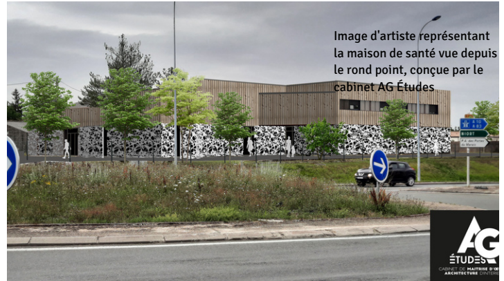
Image d'artiste représentant la maison de santé vue depuis le rond point, conçue par le cabinet AG Études

C'est à partir du début de l'année 2024, après une période de travaux de plus d'un an, que l'ouverture au public est prévue. La municipalité remercie tous ces professionnels et les assure de son soutien indéfectible pour la bonne fin de leur projet.