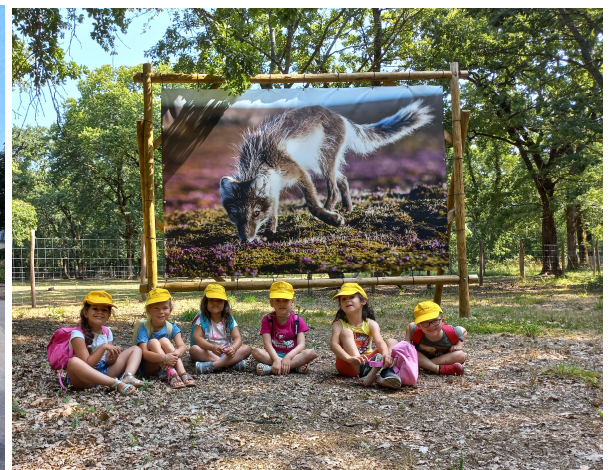
Journée au zoodyssée de Chizé le jeudi 22 juillet.

La municipalité (et plus particulièrement les adjoints en charge de ce dossier) a mis beaucoup d'énergie pour donner une nouvelle dynamique au Centre de Loisirs en facilitant le départ de l'ancien directeur désireux de s'engager dans une nouvelle voie professionnelle et en recrutant un nouveau directeur dont les premières actions ont reçu un accueil enthousiaste des familles.