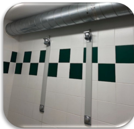
Installation d'un réseau de VMC Remplacement des douchettes

Des travaux importants ont été réalisés au Gros Buisson (la réfection des vestiaires et des douches qui étaient dans un état d'insalubrité indigne, le changement de la VMC, l'agrandissement du parking et de la route d'accès, la réparation de la fosse toutes-eaux effondrée depuis 4 ans...)