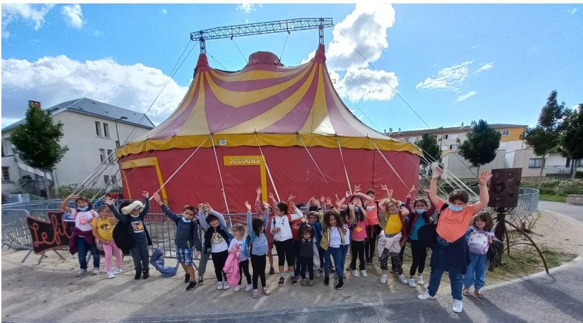
Journée au cirque le jeudi 7 juillet.